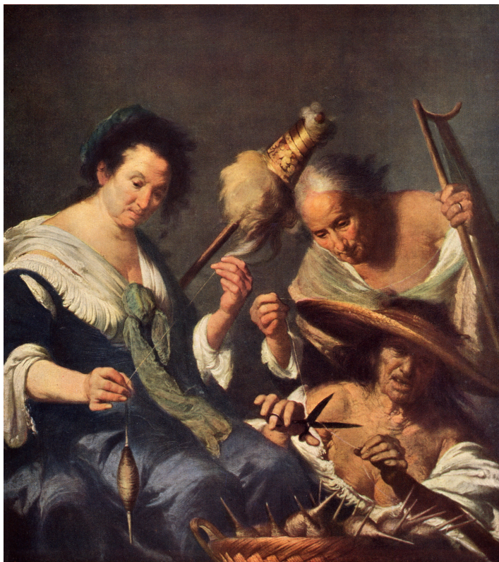
Les Trois Parques de Bernardo Strozzi (1581-1644)

Les Parques (du latin Parcae , du verbe parco, parcere , « épargner ») ou les Moires (du grec qui signifie « portions de destin assignées à chaque homme ») sont, dans la mythologie antique (surtout latine), les divinités maîtresses de la destinée humaine, de la naissance à la mort. Dans la mythologie, la vie humaine tient au fil des Parques, ténu et fragile : “La vie ne tient qu’à un fil” .